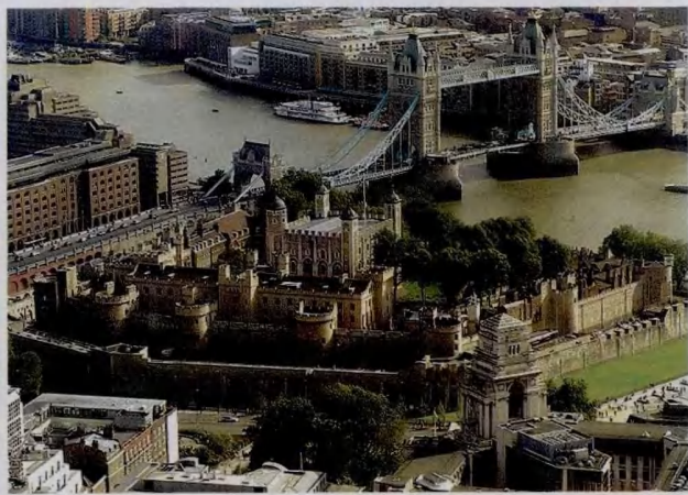
伦敦塔与伦敦塔桥