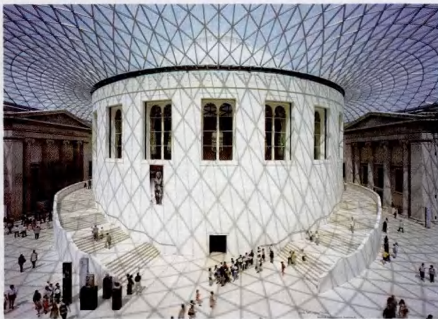
大英博物馆中央大厅