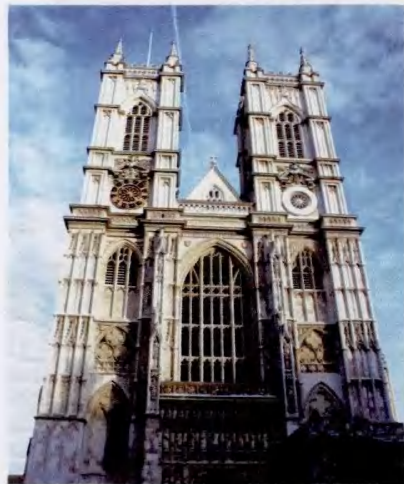
威斯敏斯特大教堂

臣,接待和宴请宾客等重要活动均在此举行。白金汉宫是一座四层正方体灰色建筑物,庄严的正门悬挂着王室徽章,宫殿前面的广场有很多雕像,群雕正中高高站立在大理石基座上的胜利女神金像金光闪闪,双翼招展,好似从天而降。到了白金汉宫,一定不要错过观看著名的卫兵换岗仪式。在旅游旺季(4-9月),换岗仪式在每天的上午11:30进行。其他季节隔天举行一次。